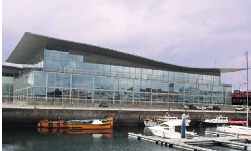
Pallexco. Palacio de Congresos y Exposiciones de La Coruña

La transmisión luminosa según la norma UNE EN 410 indica el porcentaje de la luz que llega al recinto a través del vidrio.