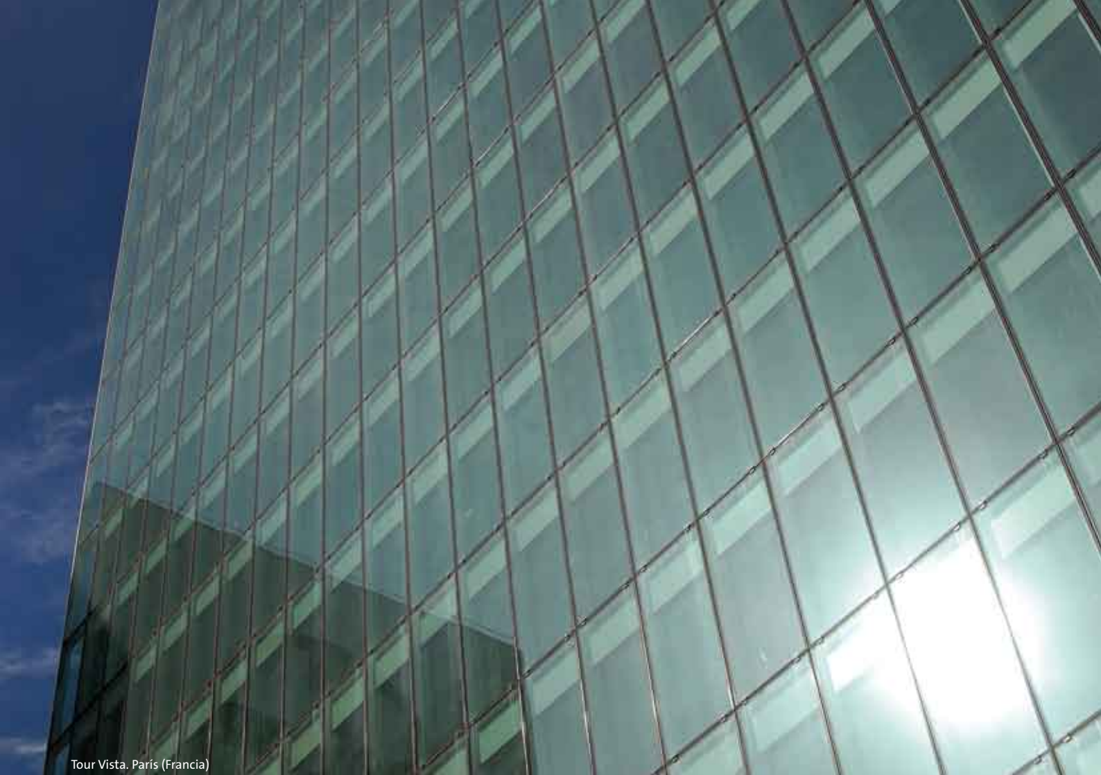
Tour Vista. París (Francia)