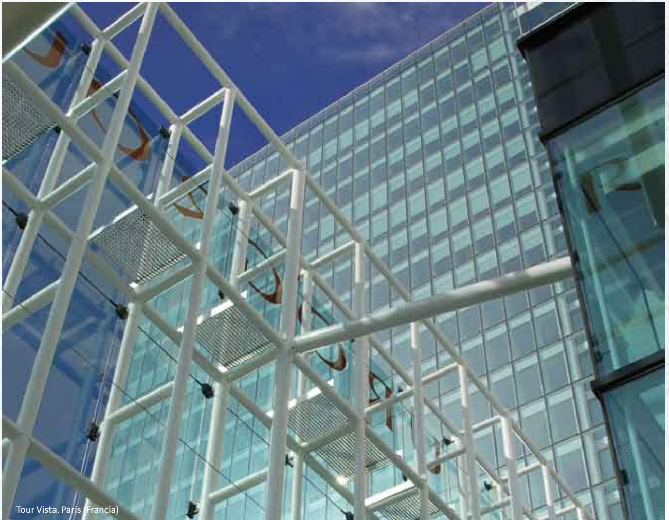
Tour Vista. París (Francia)