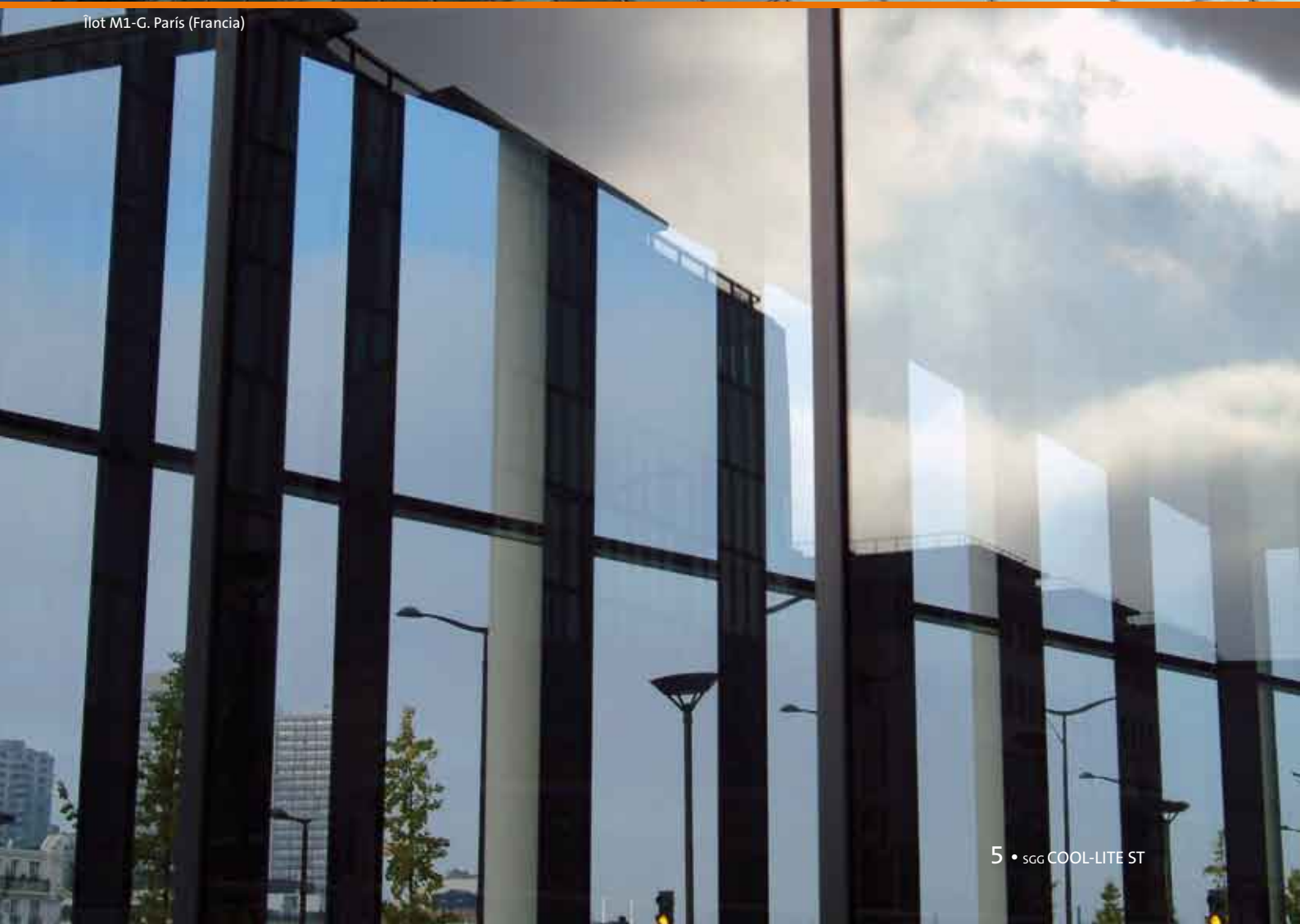
Îlot M1-G. París (Francia)